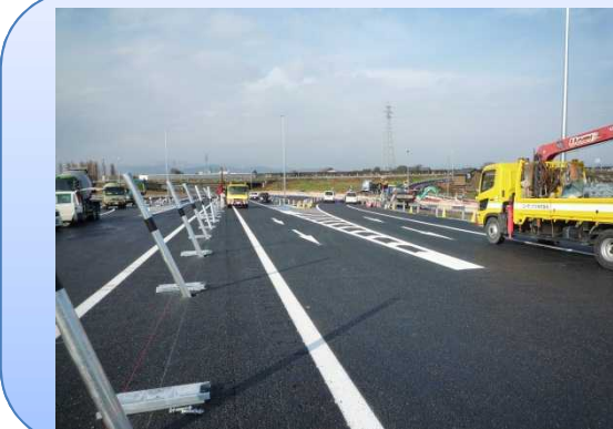
写真-4 福井北JCT(仮称)工事も着々と進行。