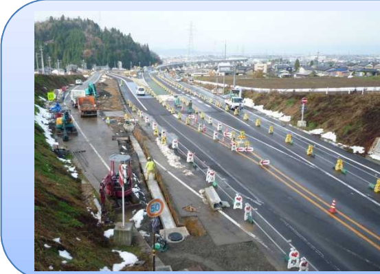
写真-3 松岡IC(仮称)工事を進めています。