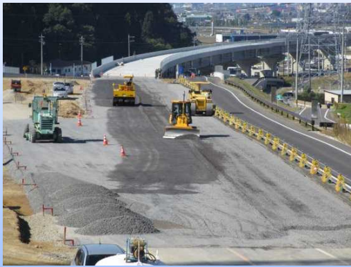
写真-3 間もなく舗装工事に取ります。