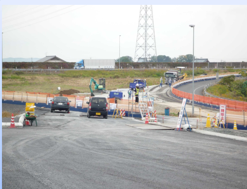
写真-4 福井北JCT(仮称)工事も着々と進行。