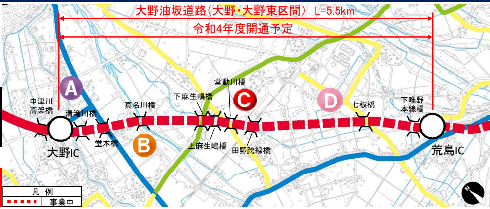
大野油坂道路（大野・大野東区間）工事状況