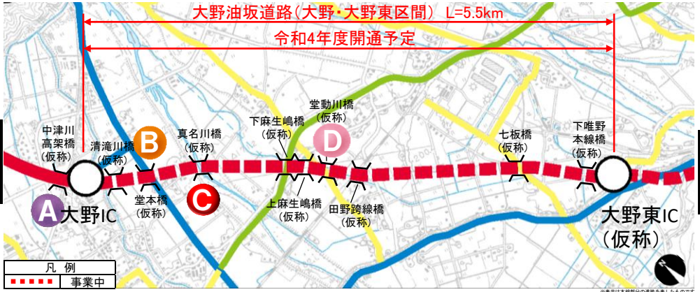
大野油坂道路（大野・大野東区間）工事状況