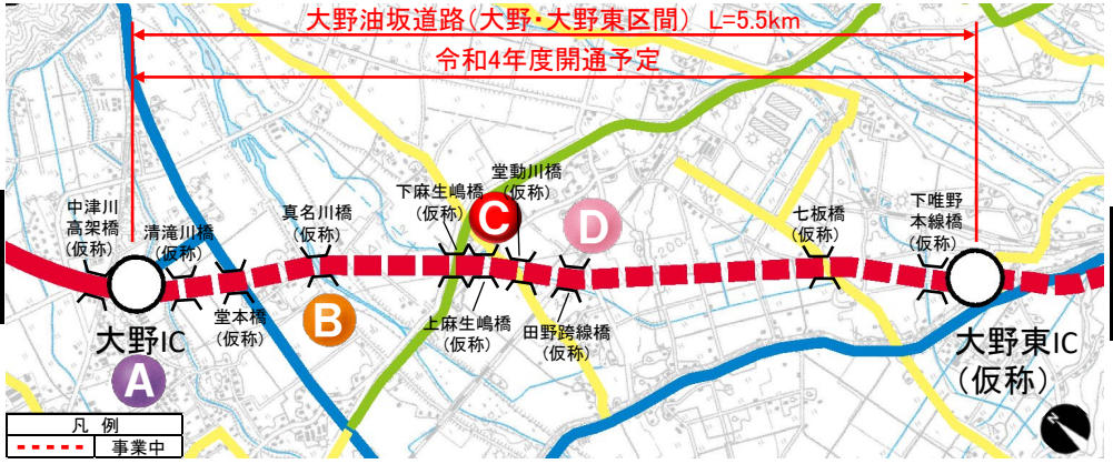
大野油坂道路（大野・大野東区間）工事状況