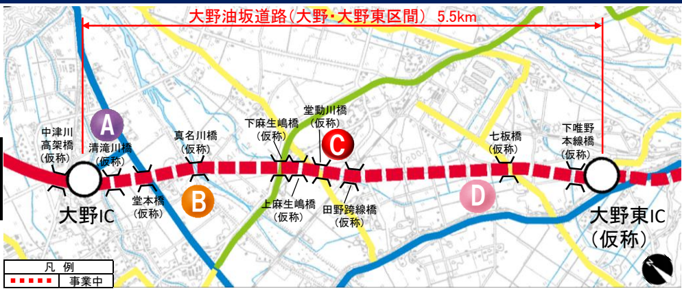
大野油坂道路（大野～大野東区間）工事状況