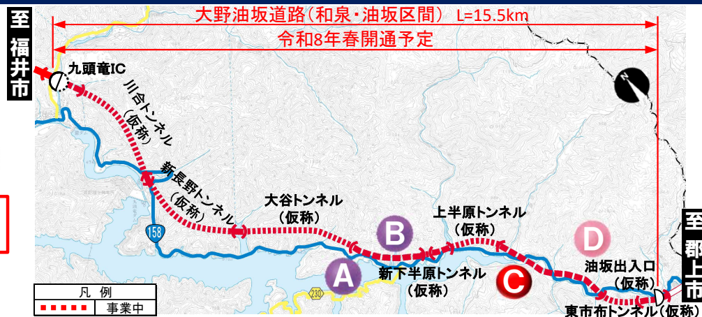
大野油坂道路（和泉・油坂区間）工事状況

※表示は本線部分の進捗を表したものです ※模式図のため現場状況と一致しない場合があります