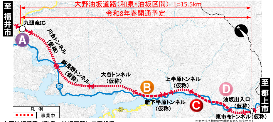
大野油坂道路（和泉・油坂区間）工事状況