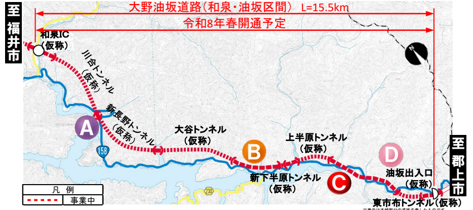
大野油坂道路（和泉・油坂区間）工事状況