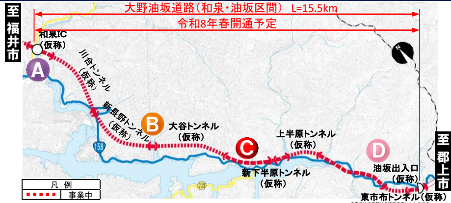
大野油坂道路(和泉・油坂区間) 工事状況