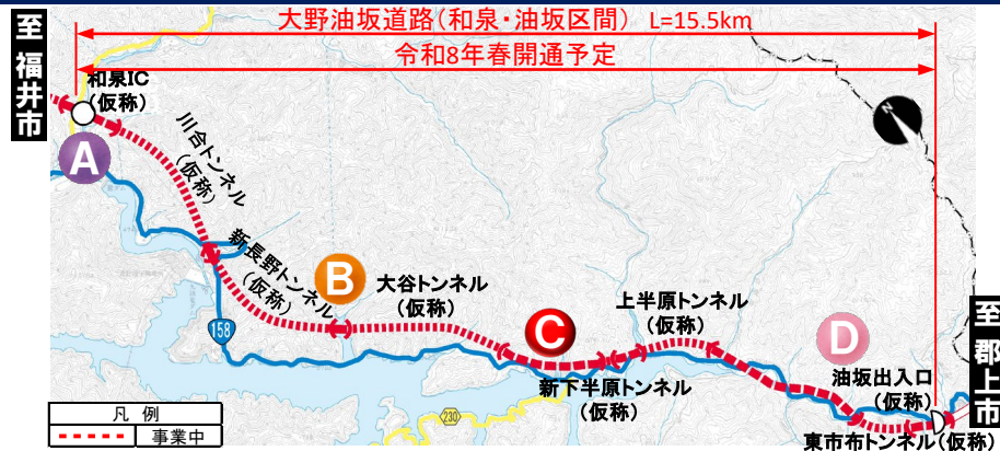
大野油坂道路(和泉・油坂区間) 工事状況