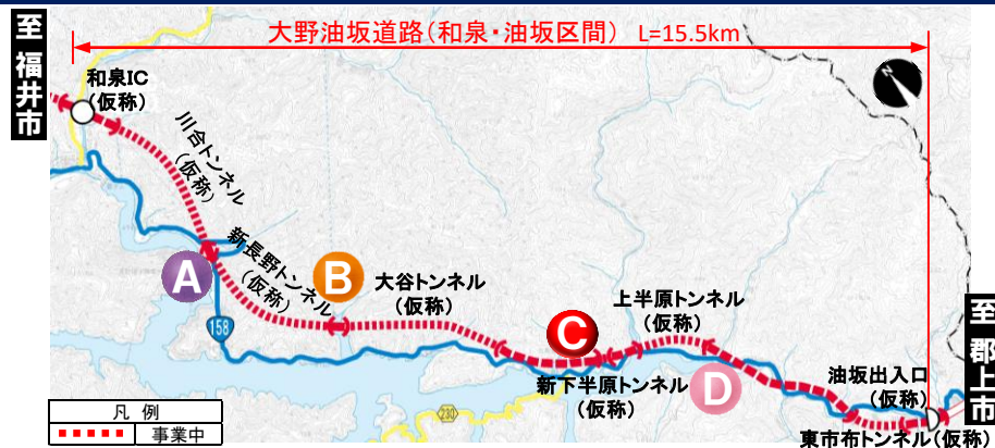
大野油坂道路 (和泉・油坂区間) 工事状況