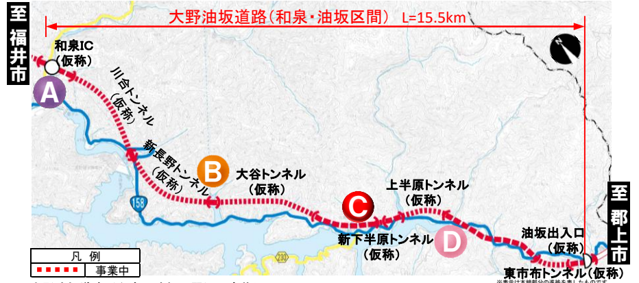
大野油坂道路（和泉・油坂区間）工事状況