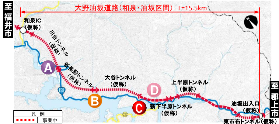
大野油坂道路（和泉・油坂区間）工事状況