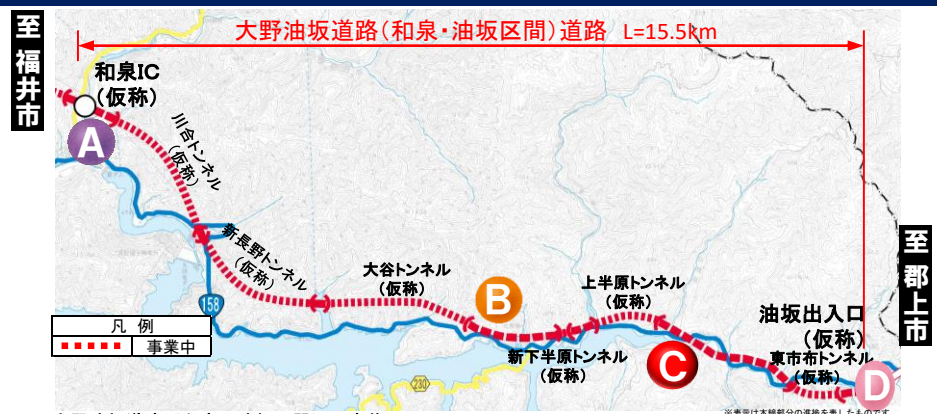
大野油坂道路（和泉～油坂区間）工事状況