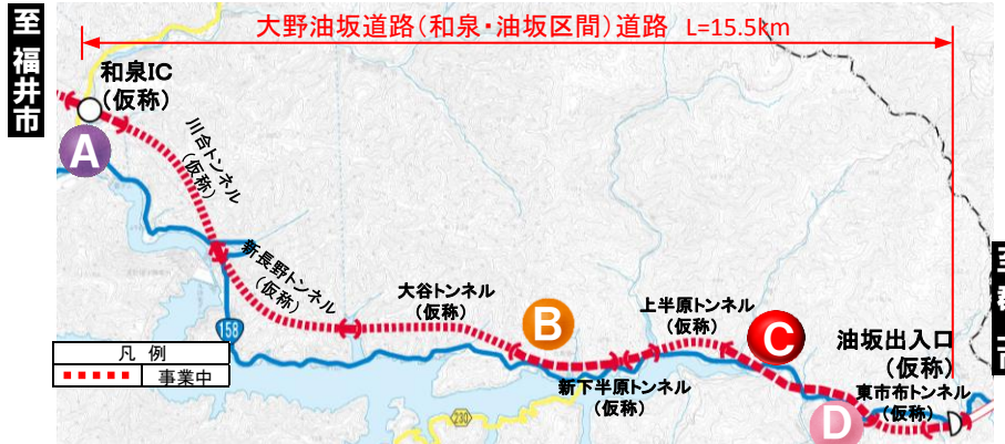
大野油坂道路（和泉～油坂区間）工事状況

※表示は本線部分の進捗を示したものです ※横式図のため観望状況と一致しない場合があります