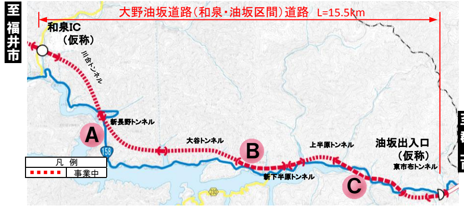
大野油坂道路（和泉～油坂区間）工事状況