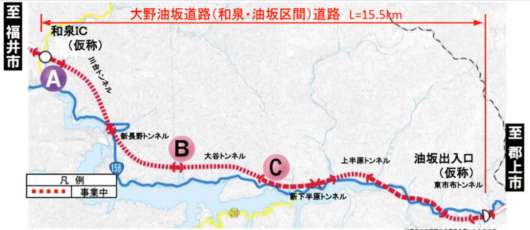
大野油坂道路（和泉～油坂区間）工事状況