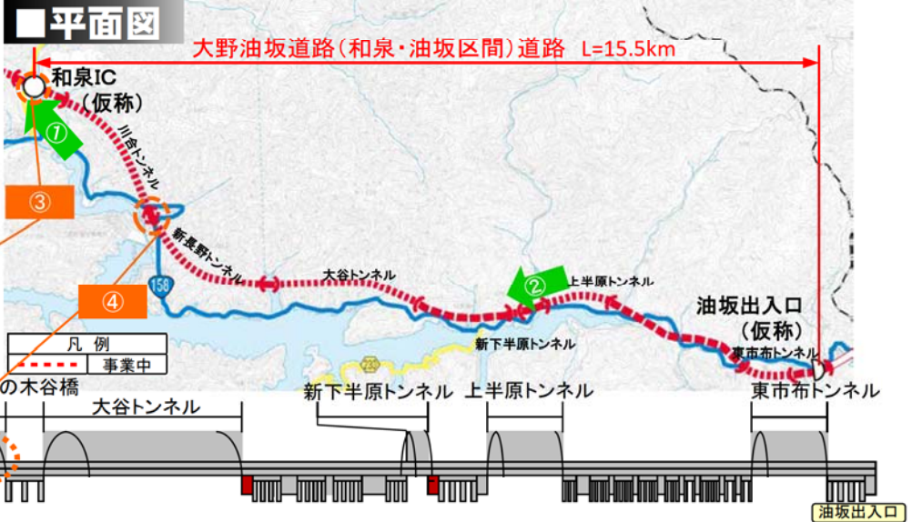
定点写真-①: 貝皿・川合地区