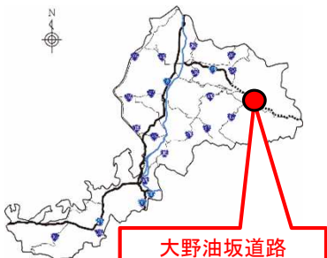
大野油坂道路 (大野東・和泉区間)