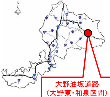
大野油坂道路 (大野東・和泉区間)