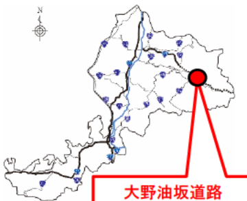
大野油坂道路 (大野東・和泉区間)