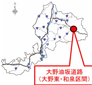
大野油坂道路 (大野東・和泉区間)