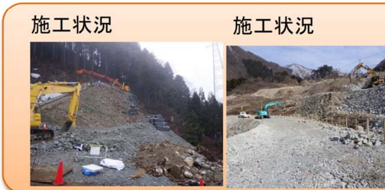
写真-③ 西勝原地区 ■荒島第一トンネル勝原坑口部の地盤改良を行っています。(写真左) ■林道付け替え部にて、盛土を行っています。(写真右)