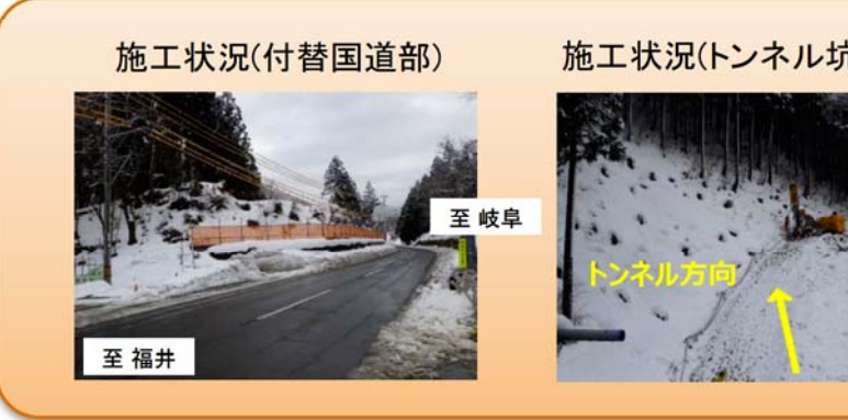
写真-③ 西勝原地区 ■付替国道部 国道から勝原ICに出入りが出来るよう、現在の国道を写真左側に付替える工事に着手します。 ■トンネル坑口部 坑口部の地盤改良工事を進めています。