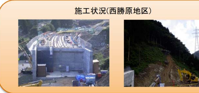
写真-④ 西勝原地先 ■白谷川橋の床版工事を進めています。(写真 左) ■トンネル坑口部の法面工事を進めています。(写真 右)

写真-③ 下山地先 ■P1橋脚 P1橋脚の底版部の鉄筋を組み立てています。 ■P3橋脚 P3橋脚の施工を進めています。