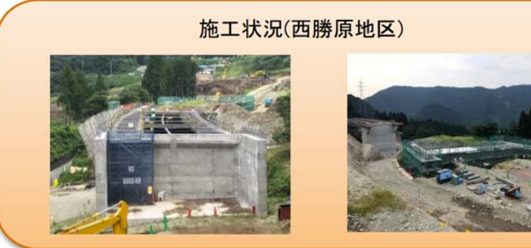
写真-④ 西勝原地先 ■白谷川橋の床版工事に着手しました。(写真 左) ■横断函渠の施工を進めています。(写真 右)

写真-③ 下山地先 ■P1橋脚 鋼矢板の仮締切工事が完了しました。均しコンクリートの打設が完了しました。 ■P3橋脚 P3橋脚の底版部の鉄筋を組み立てています。