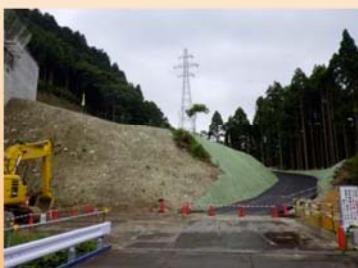
施工状況(西勝原地区)