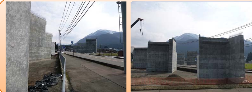
写真-④:大野東IC橋(仮称)

・工事状況 国道158号を跨ぐ、橋梁の下部工6基、全て完成し、現在は後片付け等を行っているところです。