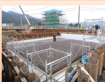
写真-④:大野東IC橋(仮称)