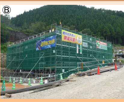
写真-③:白谷川橋(仮称)