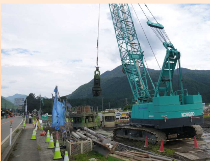
写真-④:大野東IC橋(仮称)