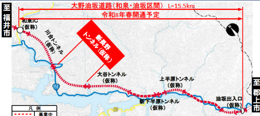
大野油坂道路（和泉・油坂区間）工事状況