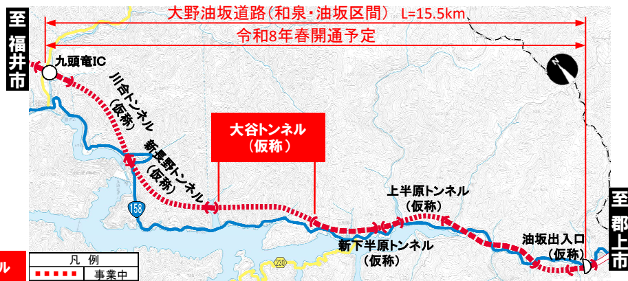
大野油坂道路（和泉・油坂区間）工事状況