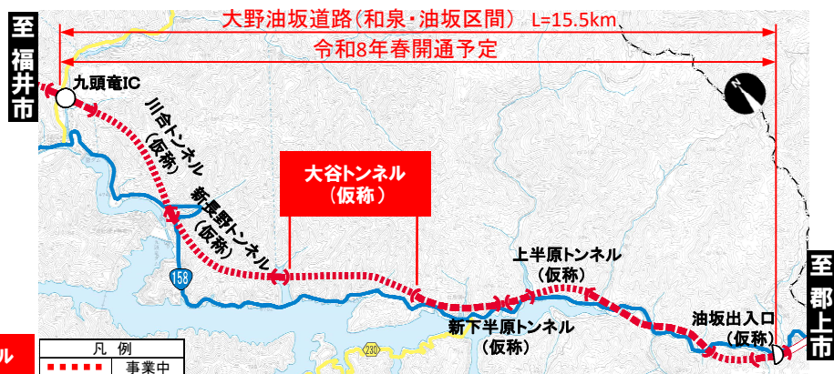
大野油坂道路（和泉・油坂区間）工事状況