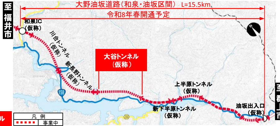
大野油坂道路(和泉・油坂区間) 工事状況