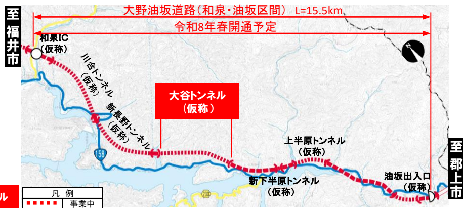
大野油坂道路(和泉・油坂区間) 工事状況