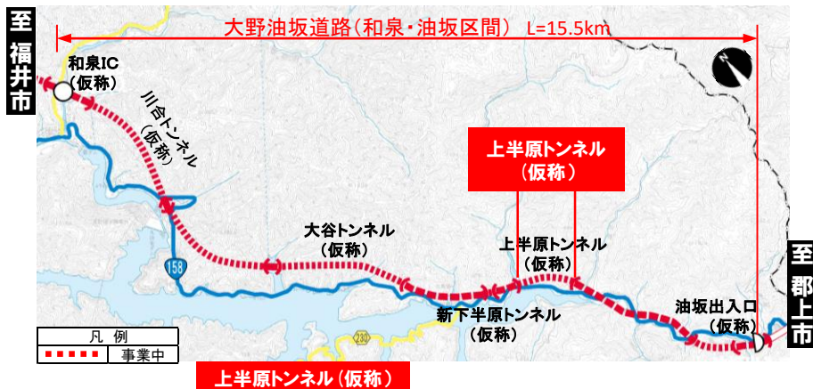
大野油坂道路(和泉・油坂区間) 工事状況