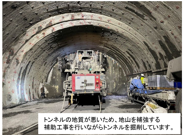
トンネルの地質が悪いので、地山を補強する補助工事を行いながらトンネルを掘削しています。