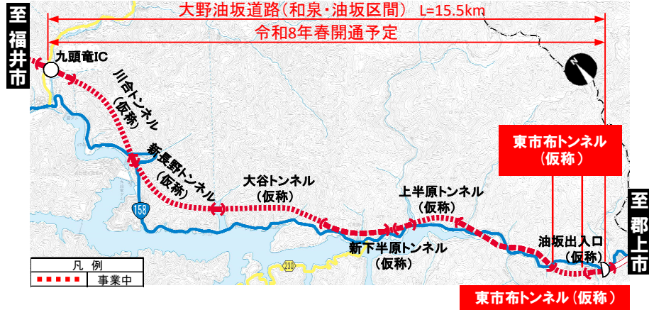
大野油坂道路（和泉・油坂区間）工事状況