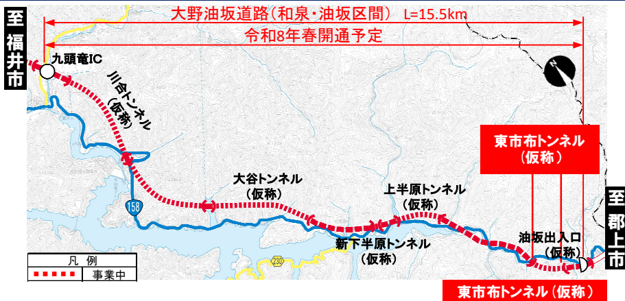
大野油坂道路 (和泉・油坂区間) 工事状況