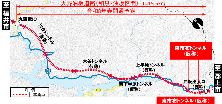
大野油坂道路（和泉・油坂区間）工事状況