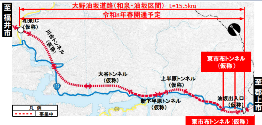
大野油坂道路（和泉・油坂区間）工事状況