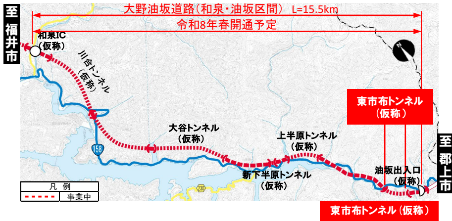
大野油坂道路 (和泉・油坂区間) 工事状況