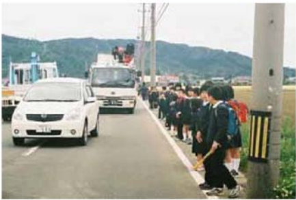
■歩道がないため危険にさらされている児童