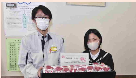
貫通石が入ったお守りを現場代理人から受け取る前生徒会長