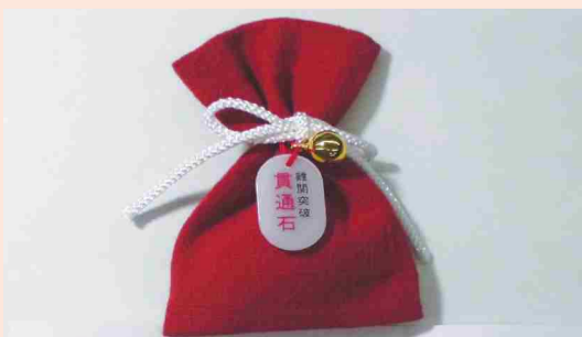
貫通石が入ったお守り