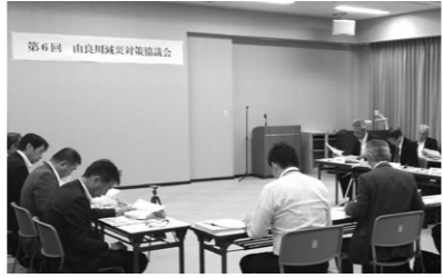
△第6回由良川減災対策協議会の開催風景

近年の水災害を受け、国土交通省では「施設では防ぎきれない大洪水は必ず発生するもの」との認識に立ち、「水防災意識社会再構築ビジョン」を策定しました。これを受けて、由良川においても減災のための取組みを実施しています。そのうち、「命を守る」ためのソフト対策の一部を紹介します。