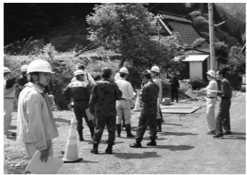
△防災パトロールの様子

した現場説明会として防災パトロールを開催しています。大雨や洪水で危険になる場所を確認し、水防資機材の状況などを共有しています。