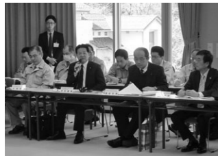
△由良川福知山タイムライン連絡会議の開催風景

洪水が発生したときに、国、府、市や住民がとるべき行動をすみややかに実施できるよう、事前に活動内容をタイムラインとして整理しています。また、防災に携わる機関で意見交換を行い、情報共有しています。