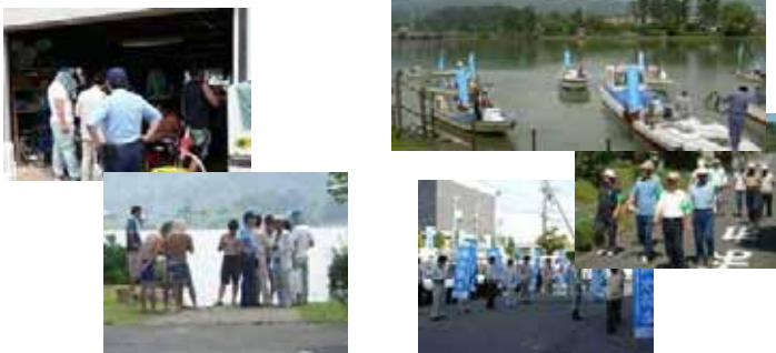
パトロールイメージ (昨年の実施状況より)