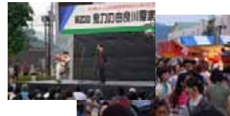
加佐・川舟レース(H20年8月10日)