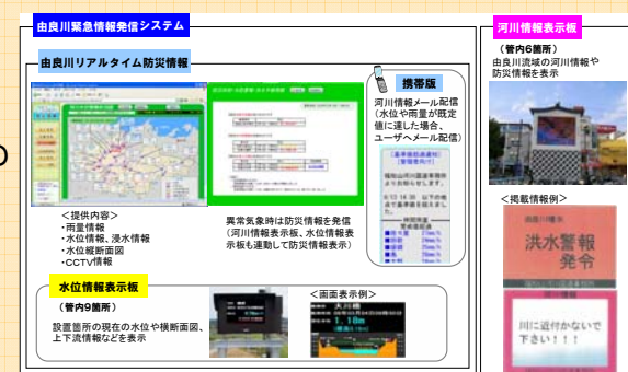
平常時・災害時の情報提供