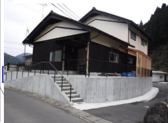
宅地嵩上げ(和江地区等)