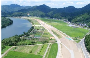
輪中堤（下東地区等）