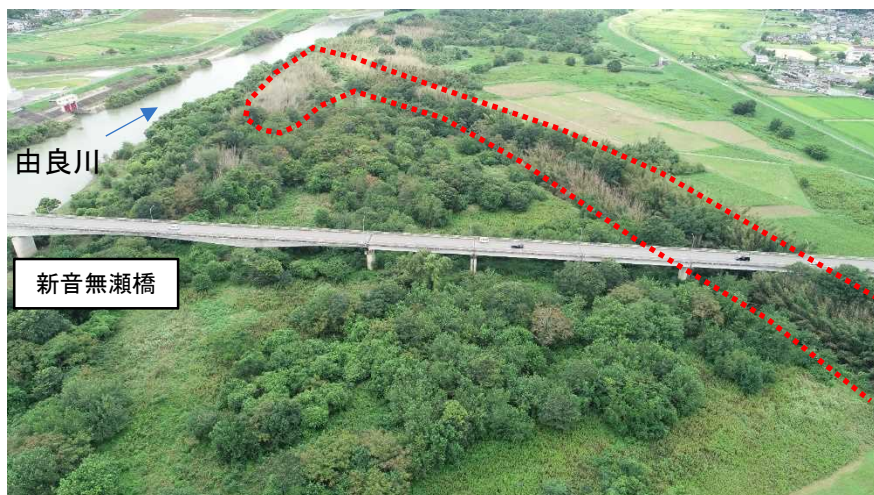
公募対象の樹木(福知山市中地先)